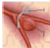
Figura 4. Aneurisma tratado con colocación de clips.

En ocasiones, el tamaño, la forma o la localización del aneurisma no permiten la colocación quirúrgica de clips ni la “embolización” endovascular. En estos casos toda la arteria en donde se encuentra el aneurisma debe ser excluida de la circulación.