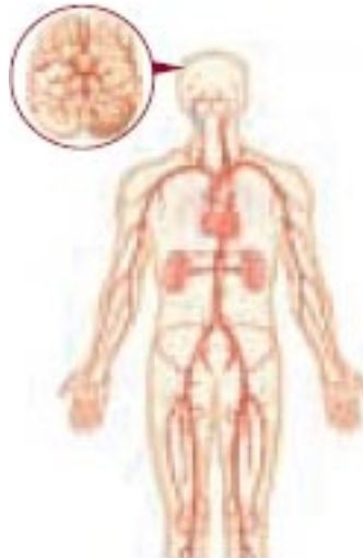
Figura 5. Tratamiento endovascular