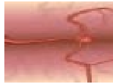
Figura 2. Crecimiento aneurismático en un vaso