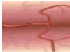
Figura 1. Vaso normal.

Un aneurisma cerebral es una deformación en una zona de debilidad en una arteria cerebral. A menudo se lo describe como un “globo” que sobresale de la pared del vaso y que, por lo general, con el pasaje del tiempo aumenta de tamaño. Los aneurismas cerebrales tienen tamaños, formas y localizaciones diferentes. La forma más común es la sacular o con forma de cereza. El saco de un aneurisma puede medir apenas 1-2 mm, pero también puede crecer y llegar a medir más de 25 mm de diámetro. Los aneurismas se producen con mayor frecuencia en los puntos de ramificación de los vasos cerebrales.